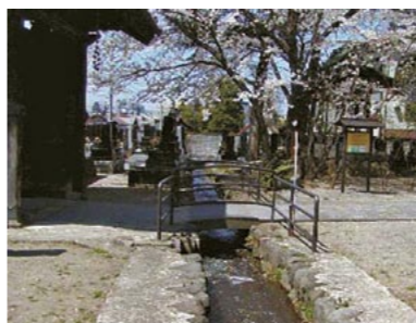
網の目のように流れている「山形五堰」のひとつ、御殿堰(専称寺)

において、「街なか観光」による賑わいの創出を図るため、「山形らしさ」を前面に打ち出