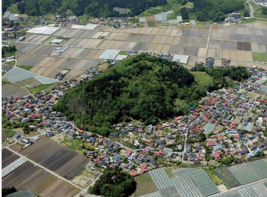
山形城主最上義光公と直江兼続公が戦った「長谷堂城跡」

「市民と事業者、行政の三者が、共にまちを創るという意味です。その三者がそれぞれ適切な力を出し合い、支え合う。あたかも、三辺が同じ面積で形作られる正三角形のような安定した社会が、持続可能なまちづくりを進める条件なのではな