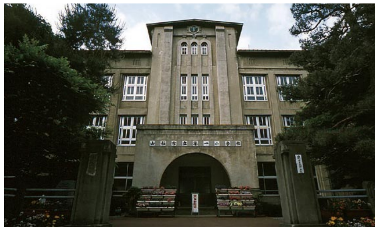
山形らしさを前面に打ち出した「第一小学校旧校舍拠点」(左)と「(仮称)山形まるごと館」として活用予定の蔵(右)