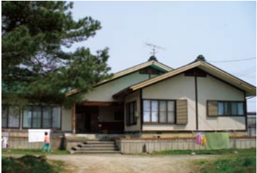
グループホーム「希望が丘東おき第1ホーム」