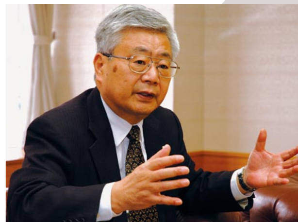
「共創」を基本方針に掲げる市川市長