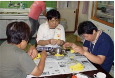
食用菊を使った食事の準備をする入居者たち