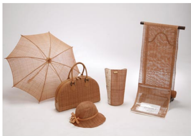
樹皮からとれる靴皮繊維で織り上げる「しな織り」