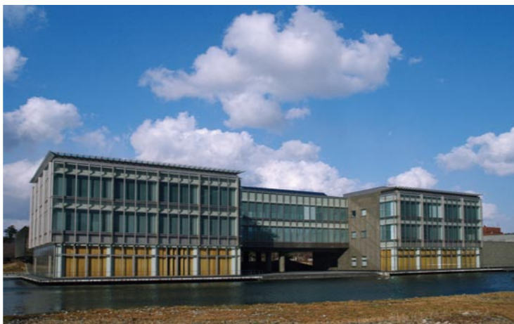
東北公益文科大学大学院と慶應義塾大学先端生命科学研究所