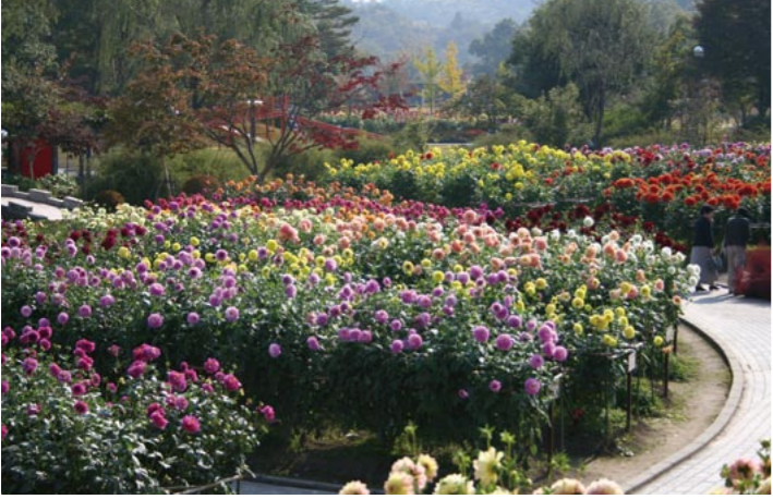
5万本のダリアが咲く「川西ダリア園」