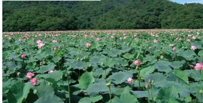
「ラムサール条約」湿地として認定された大山上池(下)・下池(上)