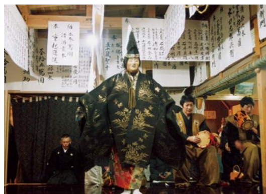
500年以上の歴史をもつ民俗芸能「黒川能」

暮らしが均質化し、まちの個性が見えづらくなっていく中、豊かな文化を市政のけん引力とする同市。市長から多く聞かれたのは「のびのびと」「楽しんで」という言葉。市民をおだやかに包むような姿勢に、この地の「個」を重視する「伝統が息づいている。」