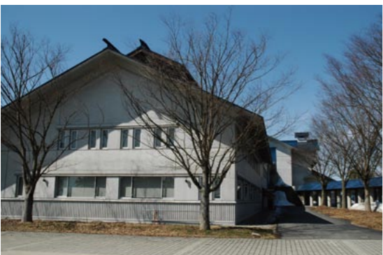
川西町フレンドリープラザとプラザ内に設けられた「運筆堂文庫」