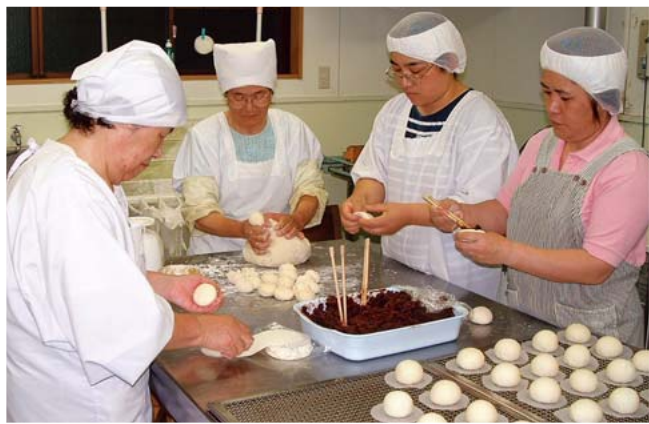
コミュニティビジネスの担い手は地域の女性たち