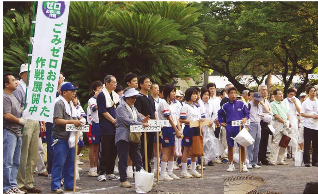
「ごみゼロおおいた作戦」には多数の団体・企業・個人が参加している