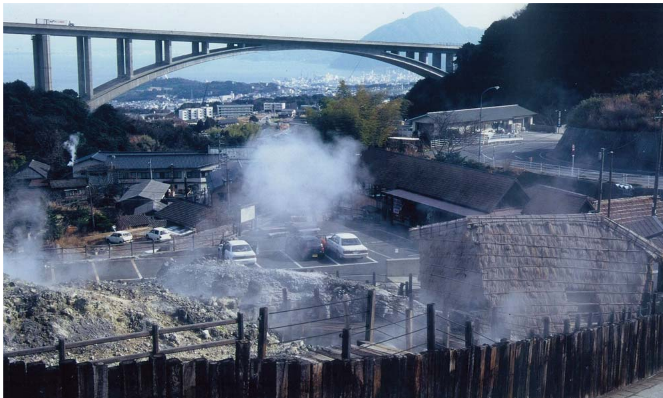
大分県内には多数の温泉地がある。写真は八つの源泉をもつ別府の湯煙

な基礎知識を習得するための講座も設けています。少子化に関しては、子どもは欲しいが経済的にたいへんだからあきらめる夫婦もいるのではと考え、保育園の通園費用を2人目は半額、3人目からは全額補助しています。これは認可外の保育園へも同様です。県立病院に周産期母子医療センターを設置し、不妊治療にも補助を出すなど、社会全体で子育てを応援しているようにしています。