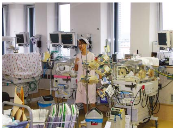
少子化対策の一環として、県立病院に周産期母子医療センターを設置

元気な高齢者に対するさまざまな施策を講じており、健康づくりに加えて、例えば生涯学習講座では趣味に関する多様な講座の他に、地域社会で活動するために必要