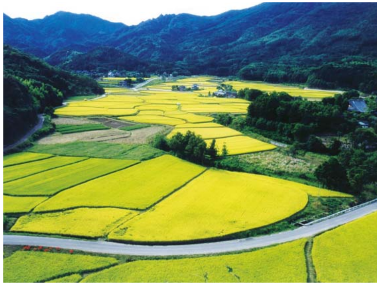
中世の荘園の遺構がそのまま残る田染荘の美しい田園風景（豊後高田市）

われわれが誇れるもののひとつに「大分国際車いすマラソン」がありますが、世界的な障害者スポーツイベントとなったこの大会には世界中からアスリートや関係者が大挙して押し寄せます。昨年、開会式をこれまでのスタジアムから商店街に移したことで、市民の注目度も増しました。 このようなさまざまな試みを通じて、安心して活力にあふれ、発展性のある郷土が少しずつ形づくられていくのだと確信しています。ユニバーサルデザインは、このような施策を展開するうえでの基本的な考え方になることでしょう。