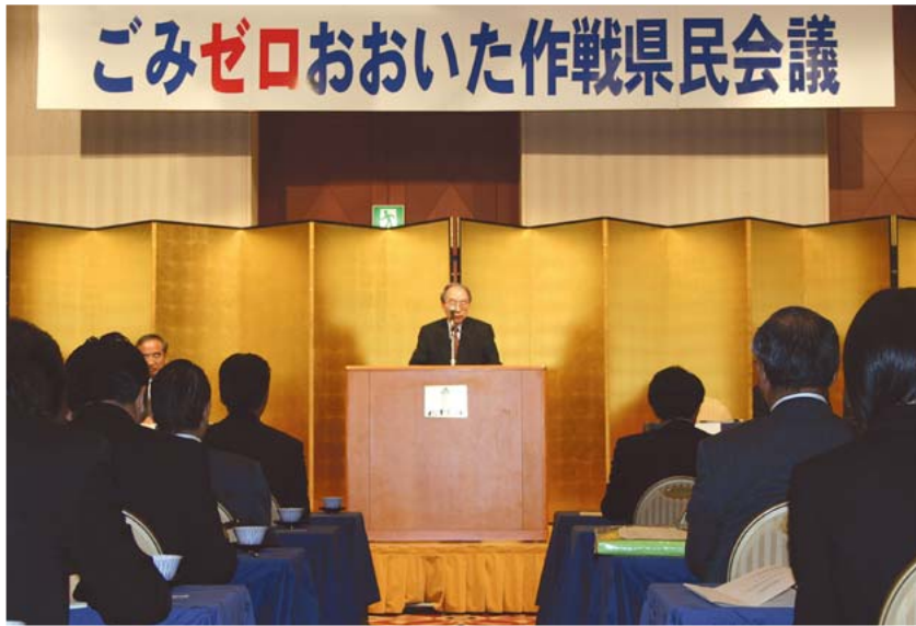
「ごみゼロおおいた作戦」は美しい郷土を守るための県民運動

われわれが誇れるもののひとつに「大分国際車いすマラソン」がありますが、世界的な障害者スポーツイベントとなったこの大会には世界中からアスリートや関係者が大挙して押し寄せます。昨年、開会式をこれまでのスタジアムから商店街に移したことで、市民の注目度も増しました。 このようなさまざまな試みを通じて、安心して活力にあふれ、発展性のある郷土が少しずつ形づくられていくのだと確信しています。ユニバーサルデザインは、このような施策を展開するうえでの基本的な考え方になることでしょう。