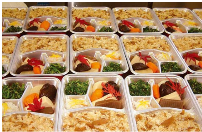
地域の食材を利用した弁当業もコミュニティビジネスのひとつ