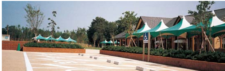
車いすの駐車スペースは主要な建物から至近距離に配置