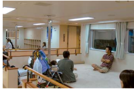
座るも寝るも自由自在の絨毯敷きコーナー