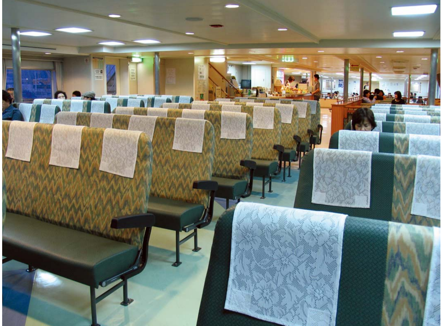
遊覧気分を楽しめる広々とした船内

2隻の新造船のうち「知多丸」はすでに完成し、現在は鳥羽・伊良湖間を就航している。鳥羽フェリーターミナルから船へのタラップは、車いす利用者が自力で行するのに十分な幅がある。自動車を積載する低層階と客室を結ぶエレベーター