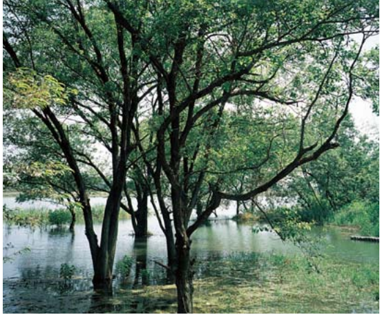
園内の3つの池はビオトープとして活用