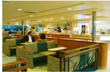
向かい合った座席を設置