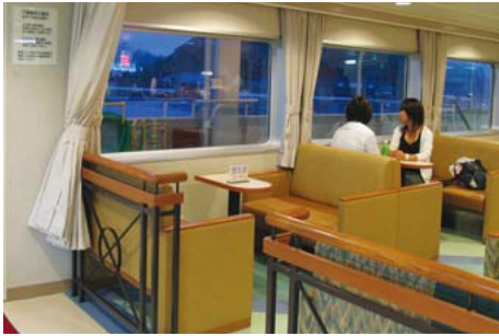
カーテンを開ければ、授乳スペースに