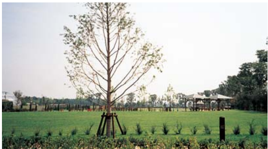
大きな集会にも使用可能な芝生の多目的スペース