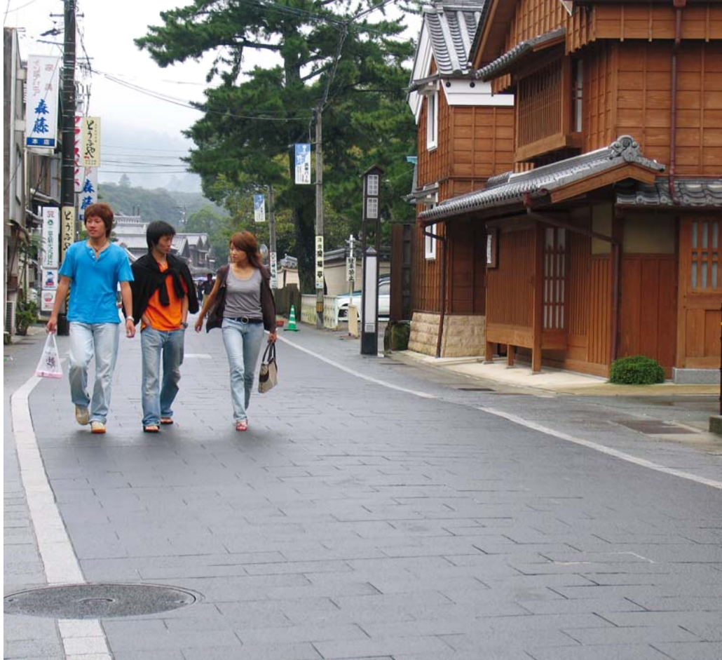
年齢にかかわらず、町歩きを楽しめる「おはらい町」。向かって右の建物が「五十鈴塾」