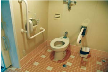
車いす対応トイレの内部

開港をにらんで来年2月、鳥羽・常滑航路を開通する。同空港はユニバーサルデザインを考慮して造られたはじめての国際空港としても、注目を集めている。この航路は風光明媚な鳥羽湾を眺め、常滑港近くでは航空機の離発着を観ることが出来るルート。常滑港と中部国際空港の距離は約5kmあるが、フェリーにリムジンバスを積載することにより、鳥羽駅・空港ターミナル間を乗り換えせず、手荷物を詰め替えることなく旅行することができる。