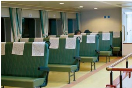
座席の前後の間隔は航空機のファーストクラス並み