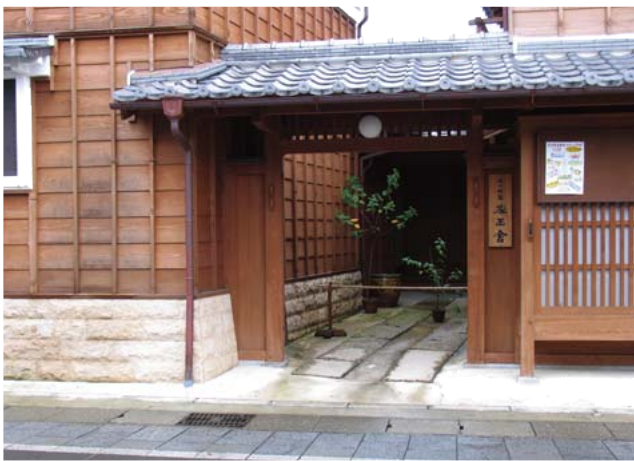
「五十鈴塾」は伝統的な日本家屋