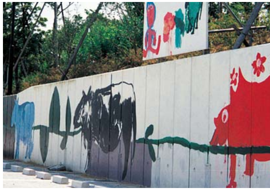
身体障害者通所施設の人々が描いた壁画