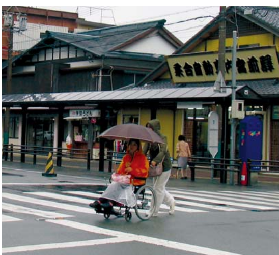
車いすの観光客も少なくない