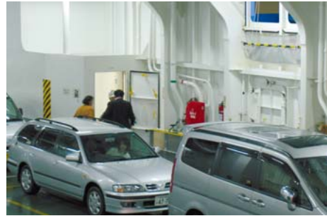
自動車の格納階には客室とを結ぶエレベーターを設置