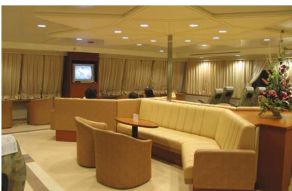
ゆったりとした船内に設けられたラウンジスペース

水面を遊ぶ海鳥、青き鳥影、空には飛行機雲。例えばこんな光景を楽しみながらの船旅は一興だ。誰もがその気さへあれば、海に開かれたまち鳥羽へ、海上から訪れることができる。