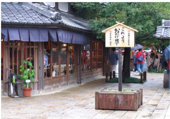
「おはらい町」の中につくられた「おかけ横丁」