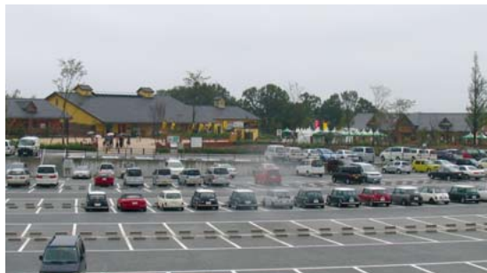
駐車場から眺めたベルファーム