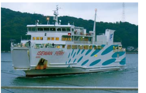
鳥羽港に入港する伊良湖行き最終便