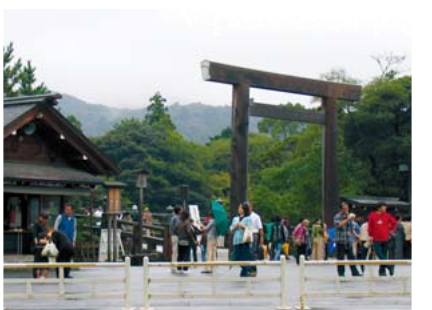
江戸時代からの観光スポット「伊勢神宮」