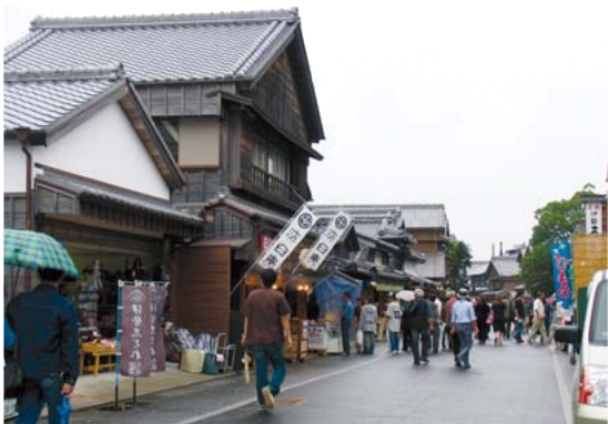
江戸時代にタイムスリップしたような街並み