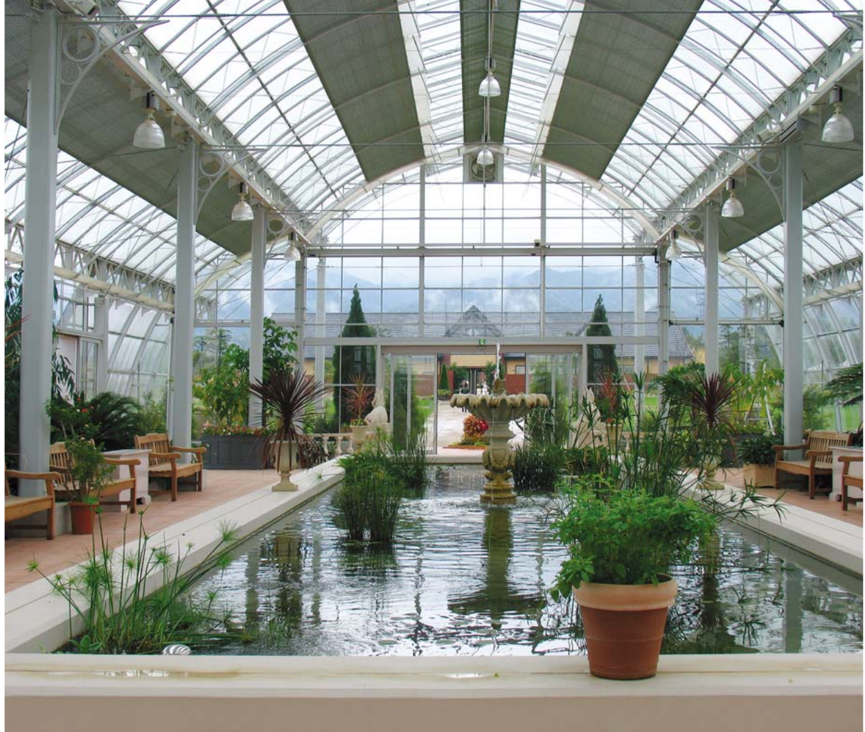
ユニバーサルデザインに配慮されているイングリッシュガーデン