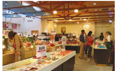
地域の産品を販売するコーナー