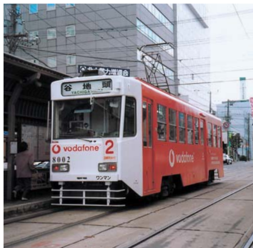
函館駅前と湯ノ川温泉を結ぶ一部低床式路面電車