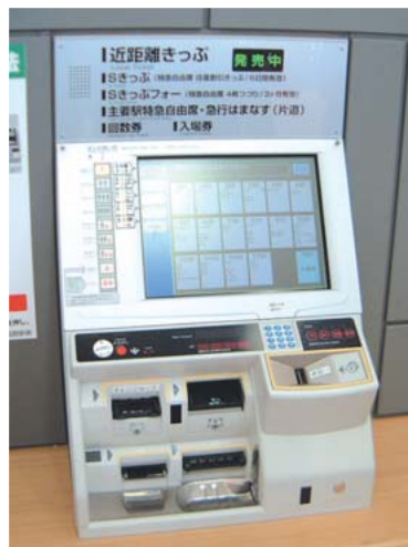
タッチパネル式の券売機