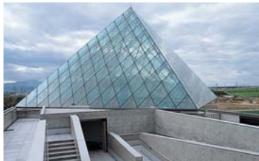
「ガラスのピラミッド」の屋上に設けられたスロープ