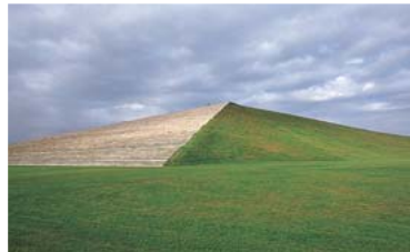
古代の遺跡を思わせる高さ30mの「プレイマウンテン」