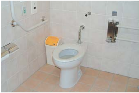
車いす対応トイレの内部