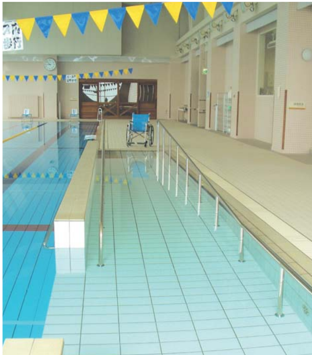
水浴訓練室の車いす対応スロープ