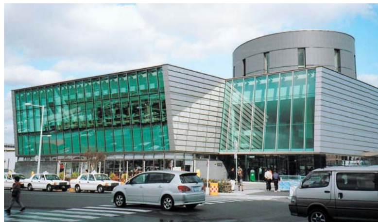
デンマーク鉄道とJR北海道との協働ワークでデザインされた函館駅