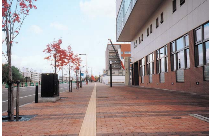
障害者福祉センター「おびつた」前の歩道には歴史性を考慮して、レンガが敷き詰められた