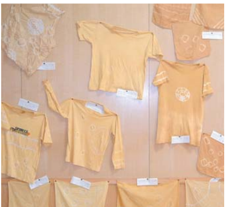
展示スペースに飾られた子どもたちが染めたTシャツ

授業は始まる。さらに、手すりが1段しかない階段の写真を示しながら、「車いすの人は使えるでしょうか?」「小さな子どもにも、手すりが届くでしょうか?」「お年寄りが楽に上の階へ行くでしょうか?」と矢継ぎ早の質問。子どもたちはいつも見慣れた階段の不便さを通して、人がそれぞれ違いを持っていることに気づくのだ。