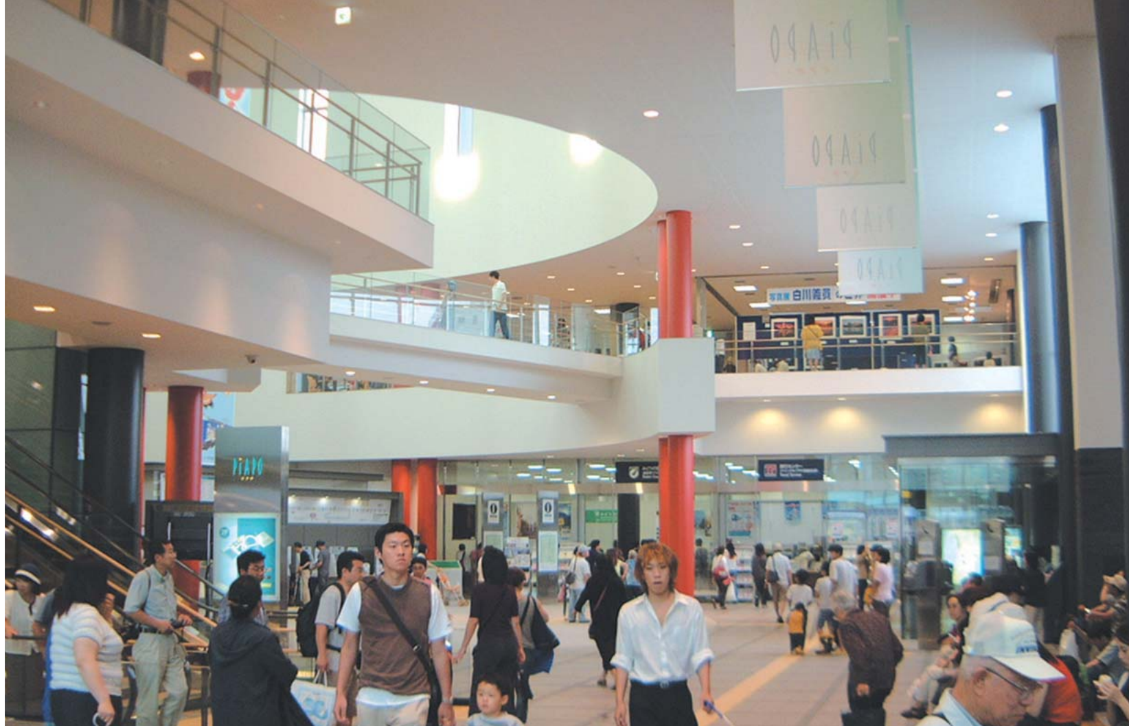
函館駅のコンコース。2階には情報センターや展示コーナーが設けられている