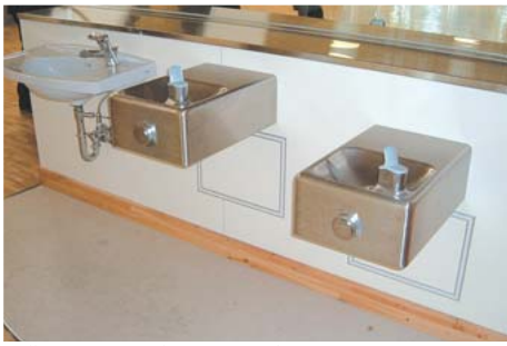
各階に設置された高さの異なる水飲み台