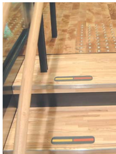
わかりやすい階段のステップ