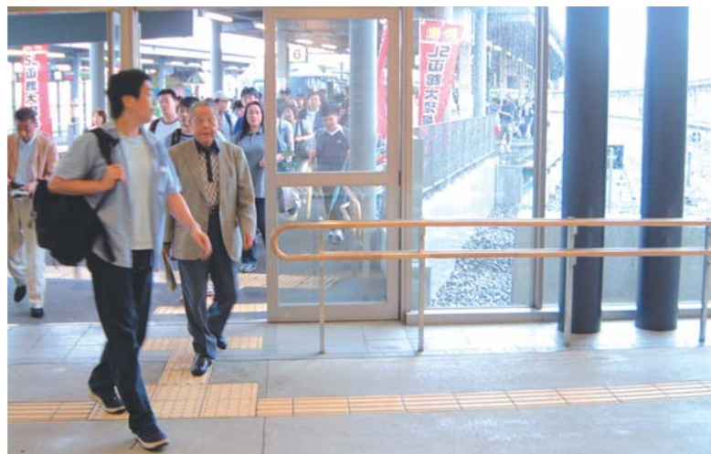
プラットフォームには2段手すり設置された