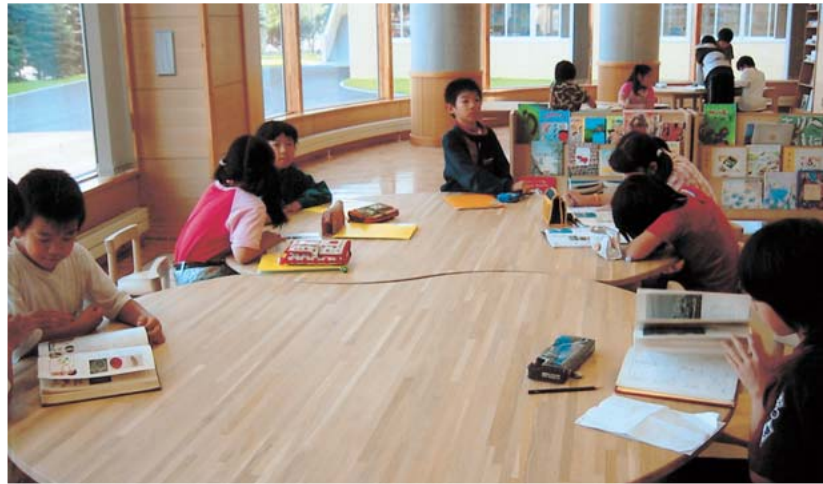
上: 校内LANが構築されているコンピュータ室 下: 採光と木の温もりに配慮した図書室