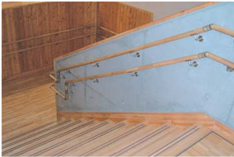
すべての階段には2段手すりを設置