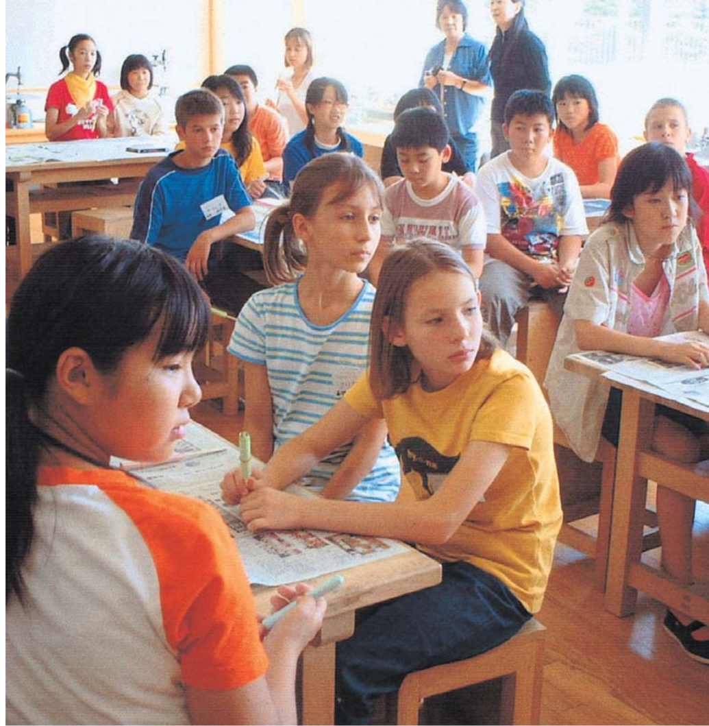
ベラルーシの子どもたちとの交流