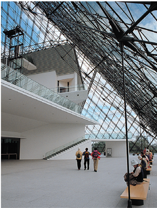
光のシャワーが降り注ぐ「ガラスのピラミッド」内のアトリウム

ガラスのピラミッド内にあるレストラン「アンファン・キ・レーブ」はフランス語で「夢見る子ども」の意味だ。地球に夢を刻もうとしたイサム・ノグチを意識して付けられた名前なのだろう。