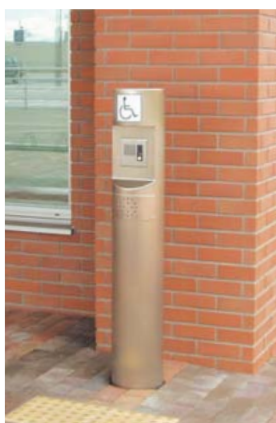
屋外インターホンポール

障害のあるなしにかかわらず多様な人々が利用することそれ自体が、ノーマライゼーションの理念が生かされている施設だといえるのではないだろうか。