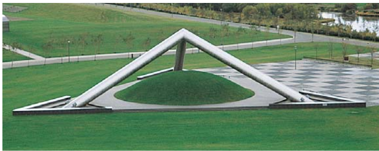
一辺29mのステンレス柱の組み合わせによる三角錐(高さ13m)「テトラマウンテン」