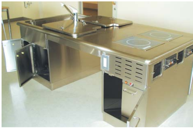
車いす対応調理台