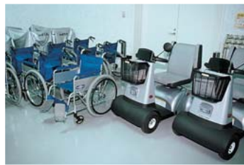
レンタサイクル場では車いすの貸し出しも行っている

「私の創作に対する情熱の根底にあるものは、(中略)スペースに、そして彫刻に人間性を与えるという意味でもありません。単に審美的な目的ではなく、エゴのためでもありません。あるいは考古学や砂漠のイメージでもありません。それは現実に関与したものであり、人々の生活に大きな役割をもつためのものなのです」(「京都賞」受賞記念講演より)