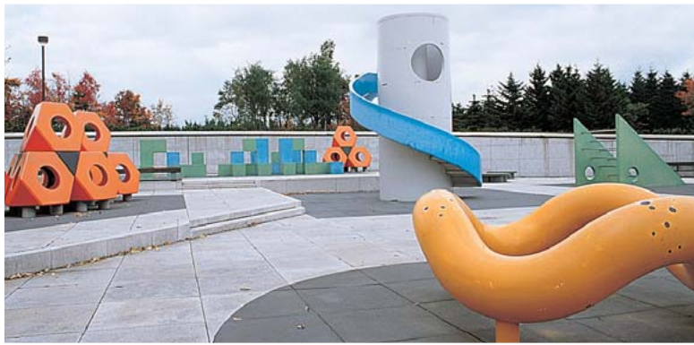
すべての遊具をイサム・ノグチがデザインした「サクラの森」