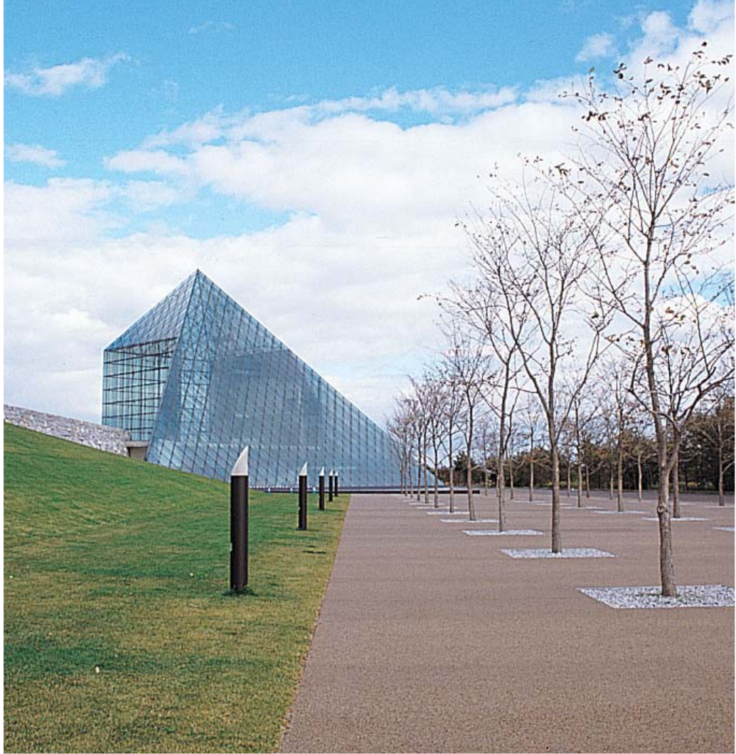
総合案内所を兼ねる「ガラスのピラミッド」へのアプローチは平坦な遊歩道